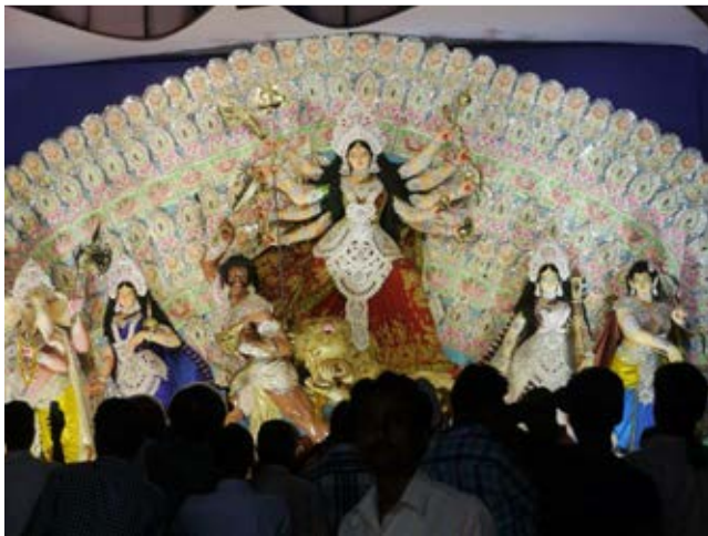
Anlässlich des Festes der Göttin Durga war das Gedränge in den Straßen noch größer als sonst und kleine Jungs bieten Schnick-Schnack zum Verkauf an.