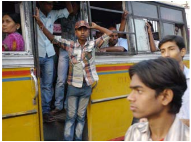
Kindliche Busbegleiter werben lautstark um Reisegäste