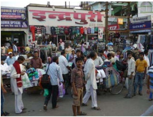
Im Bazar von Patna herrscht undurchsichtiges Gewimmel